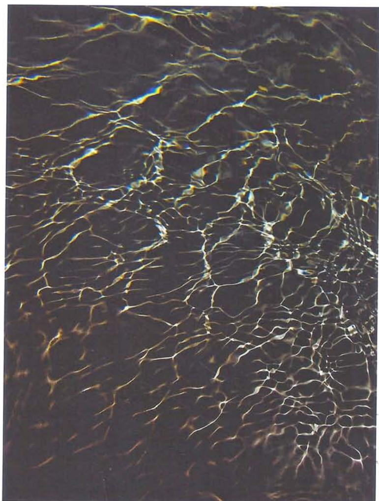
Série Toile de lumière