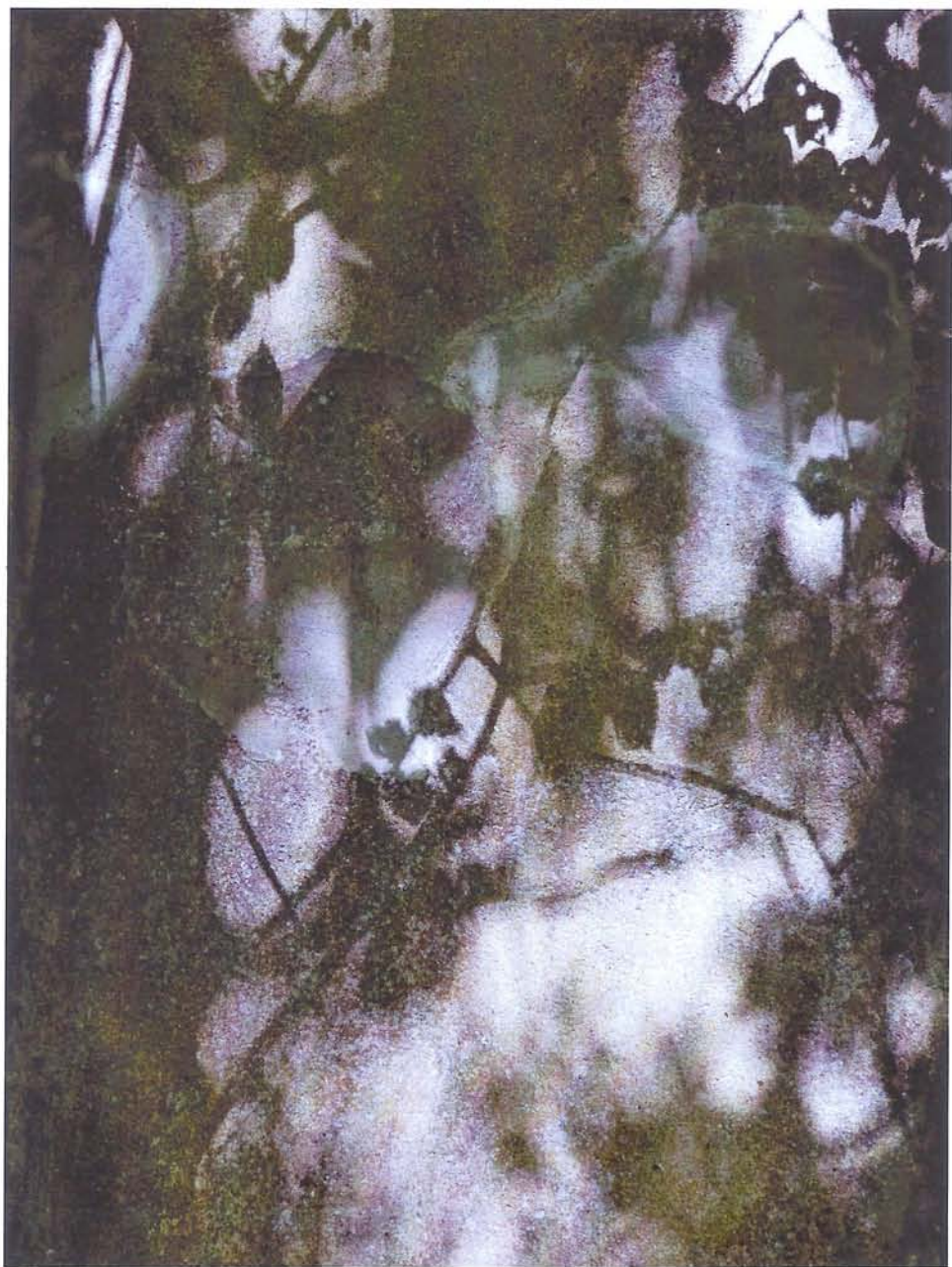
Série Variations d'ombres