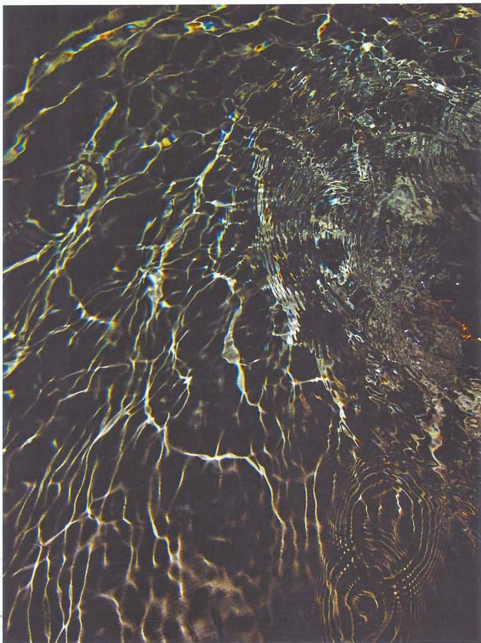
Série Toile de lumière